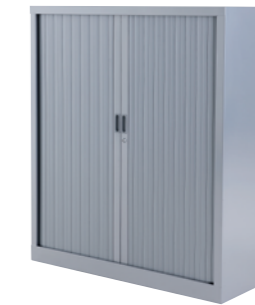
Project 371 100x170x43 cm