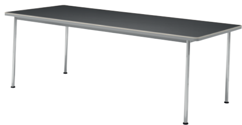
Gispen 515 220x100 cm