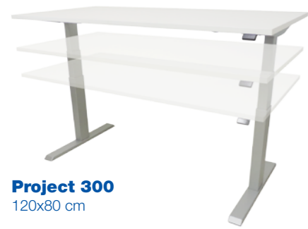
Project 300 120x80 cm