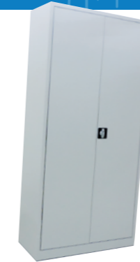
Economy 270 195x92 cm