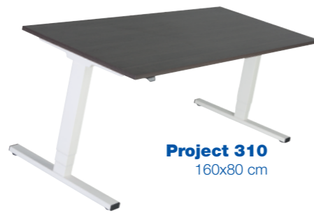
Project 310 160x80 cm