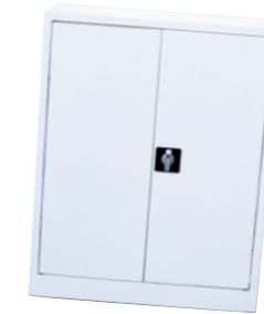
Economy 271 120x80 cm