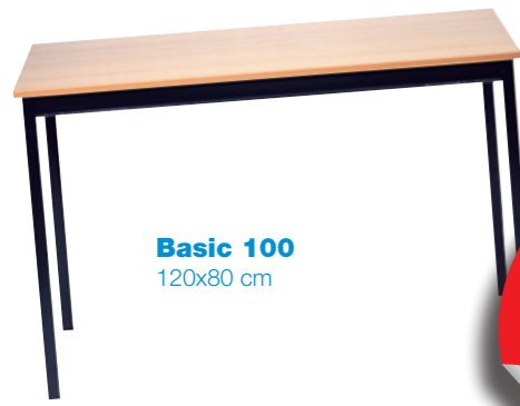
Basic 100 120x80 cm