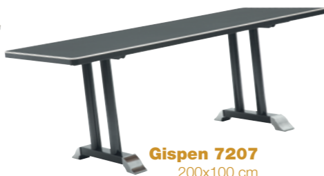
Gispen 7207 200x100 cm