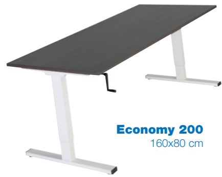
Economy 200 160x80 cm